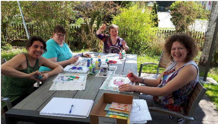
Atelier "in action" / Atelier en action