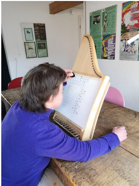
C.W. spielt Veeh-Harfe / C.W. joue de la harpe Veeh

C.R.: J'ai passé mes vacances à St-Gall, chez mon ami. Maintenant, je connais bien St-Gall.