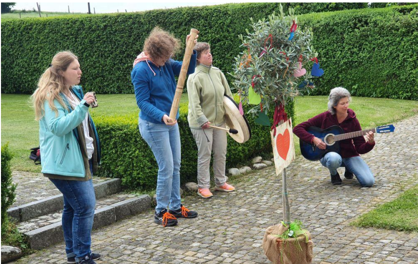
Auftritt der Jabahe-Band (es sind nicht alle Mitglieder auf dem Foto)

Groupe de musique Jabahe en scène (pas tous les membres du groupe sont sur la photo)