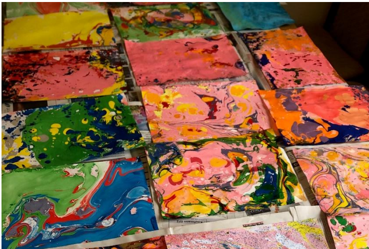
Werke aus dem Atelier / oeuvres de l'atelier