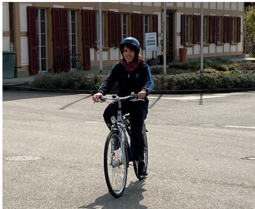
M.M. auf dem Velo / M.M. sur le vélo