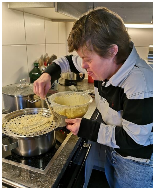
C.W. beim Kochen / C.W. en train de cuisiner

Les parents / représentants légaux ont soutenu les mesures que nous avons prises et la collaboration a été très positive.